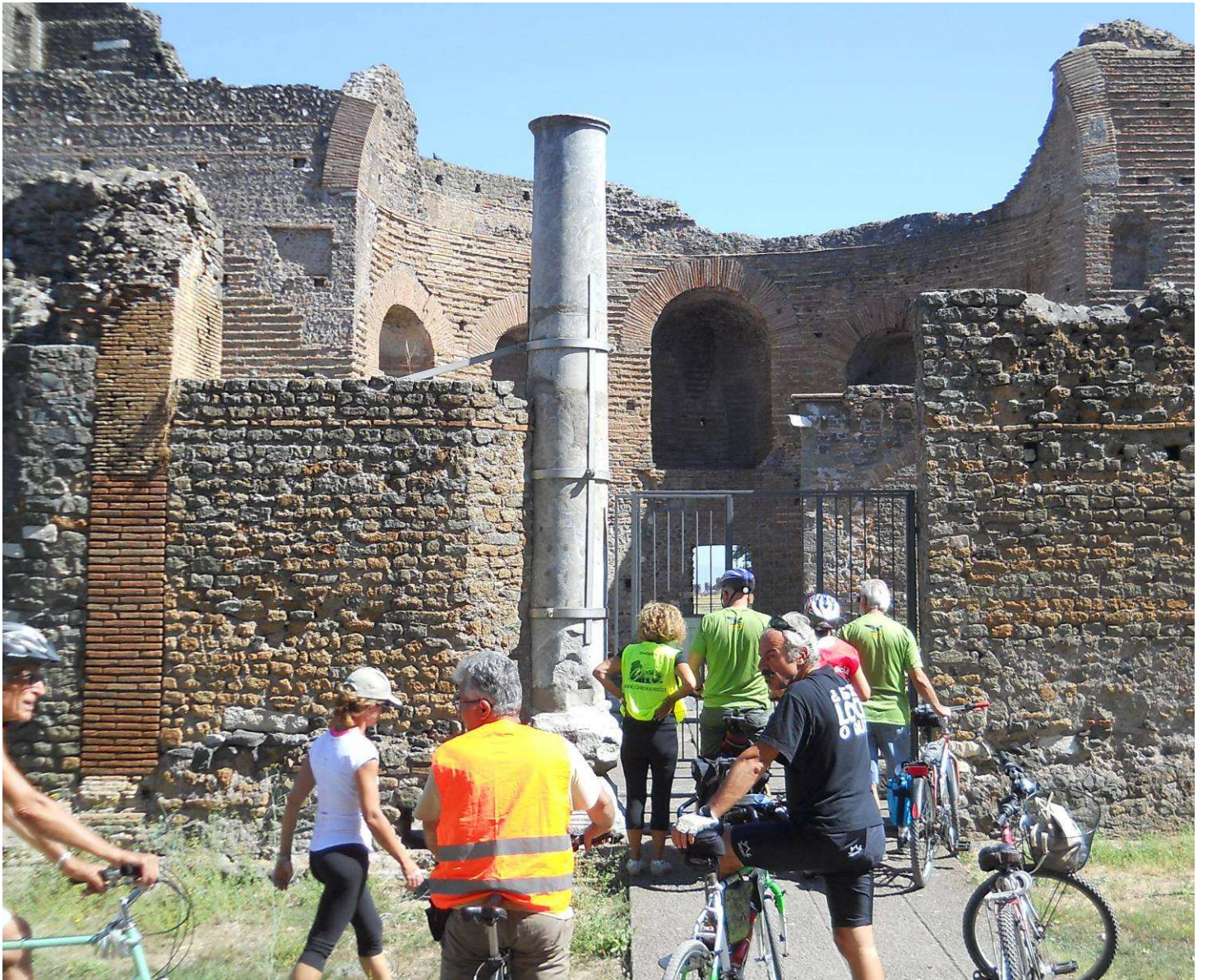
... e per la villa dei Quintili....