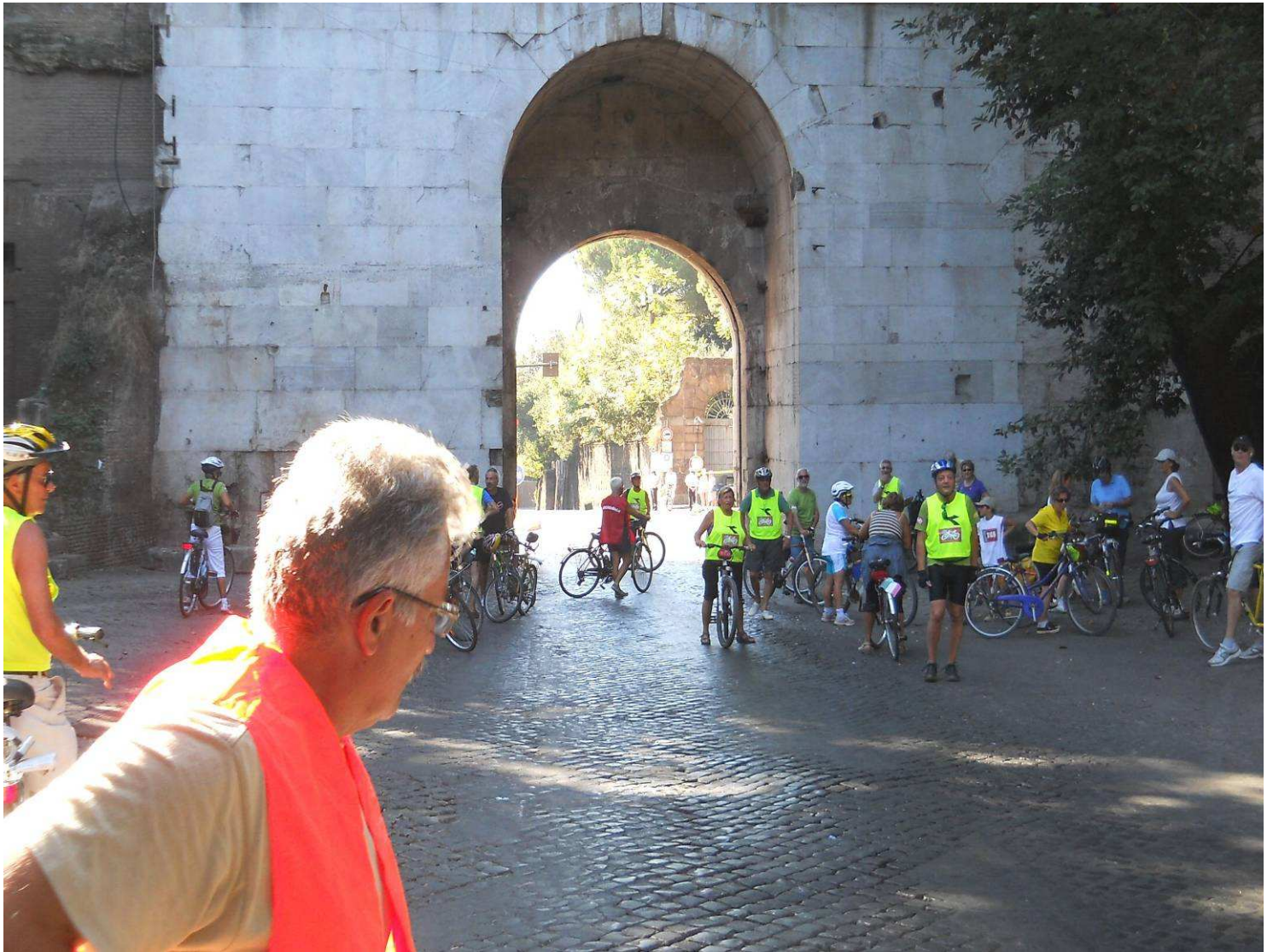
...siamo passati sul monte Celio, porta Metronia, piazza Numa Pompilio, via Appia antica, "sosta di ricompattamento" a Porta Appia , più conosciuta come Porta San Sebastiano .