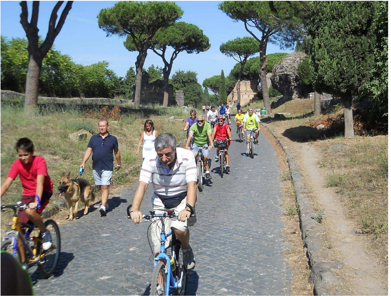
E' una splendida e calda giornata, parecchie persone si godono con noi queste bellezze....