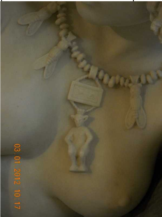
particolari della collana e... il serpentello