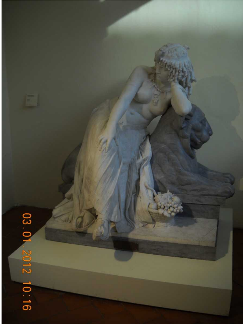
Cleopatra con i