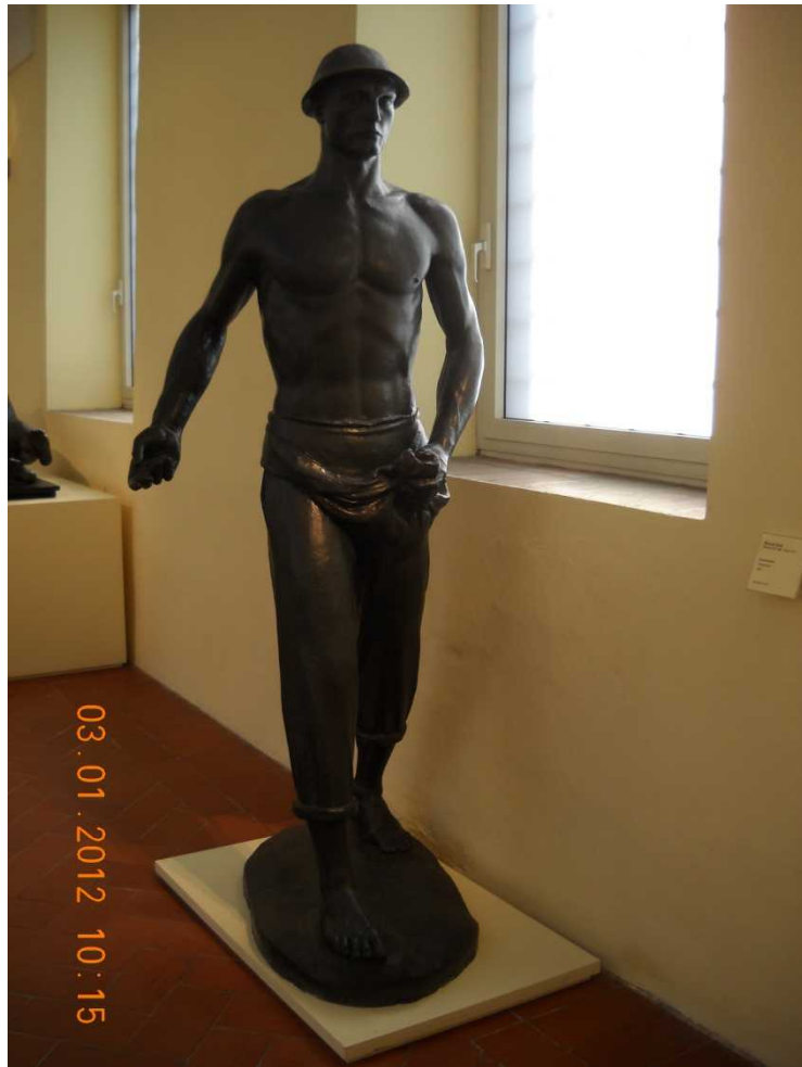
Ercole Drei: il seminatore