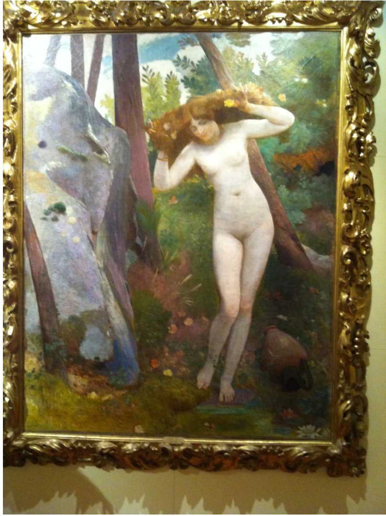
Nino Costa: alla fonte!