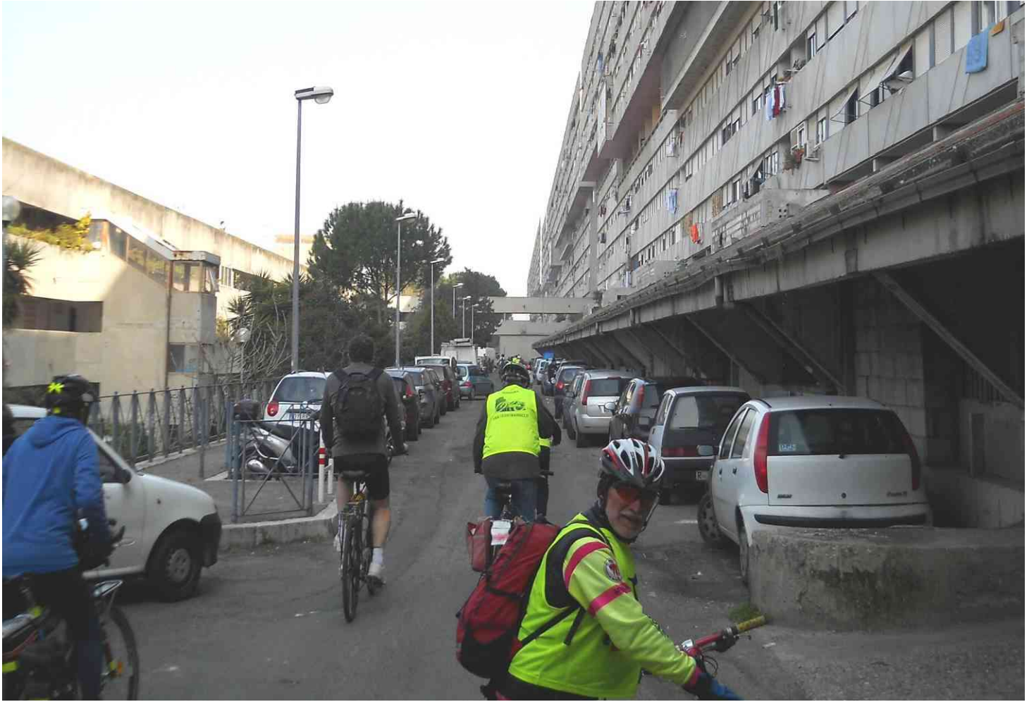
....e dietro, via Ettore Ferrari...