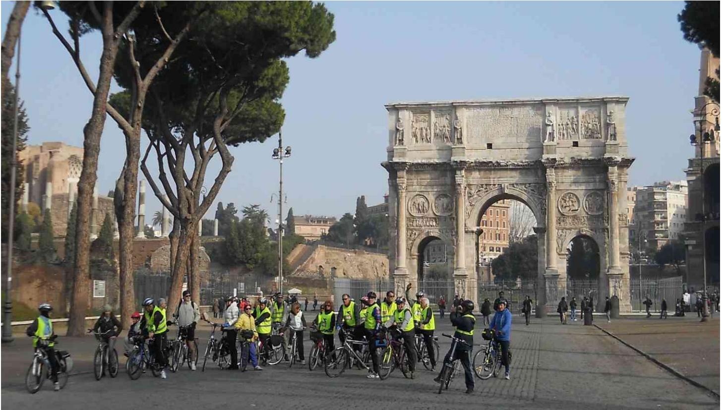
Foto di gruppo alla partenza, tanto per cambiare un po' siamo in posa davanti all'Arco di Costantino , siamo poco meno di 30....