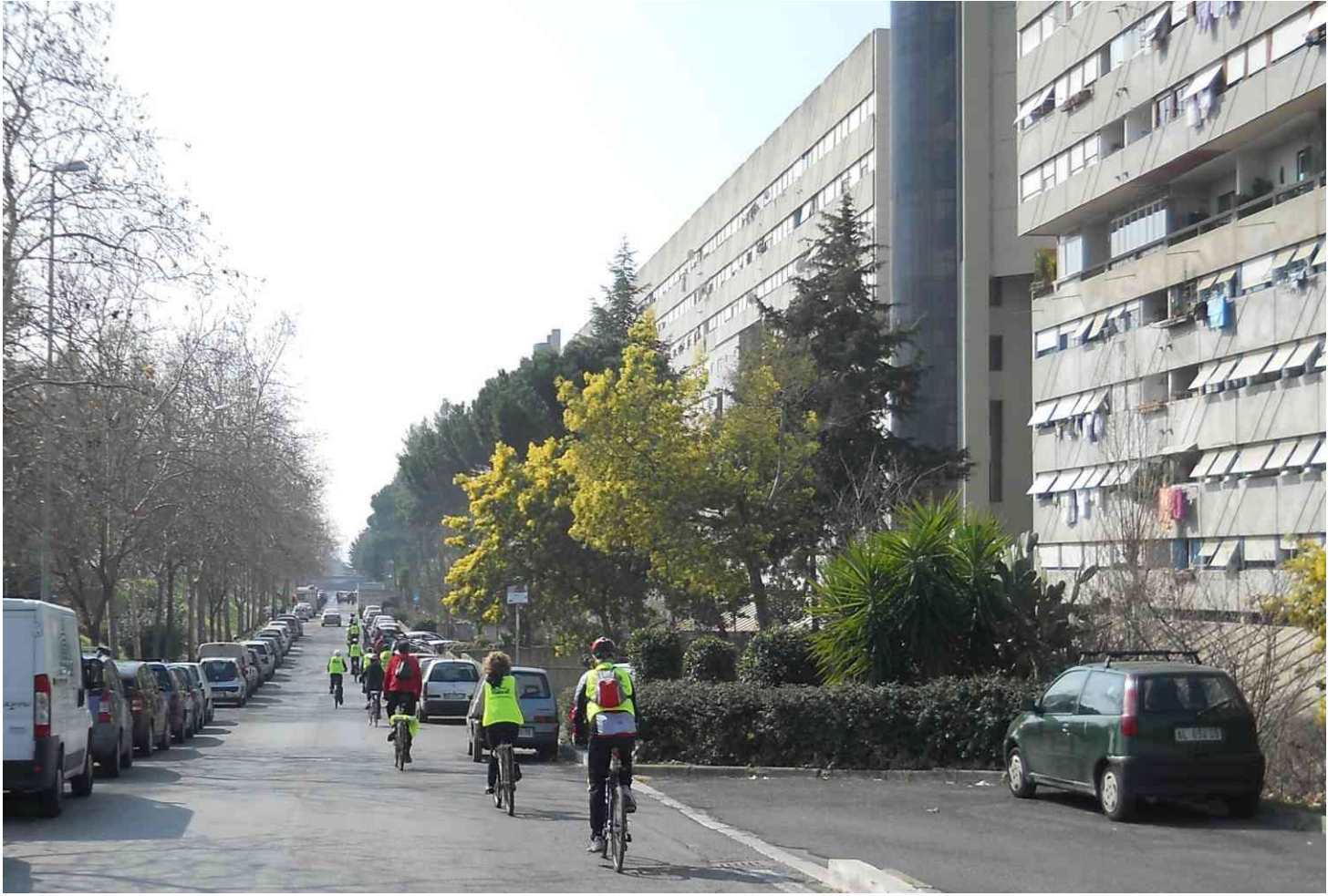
questo palazzo lungo un km: davanti, via Marino Mazzacurati...