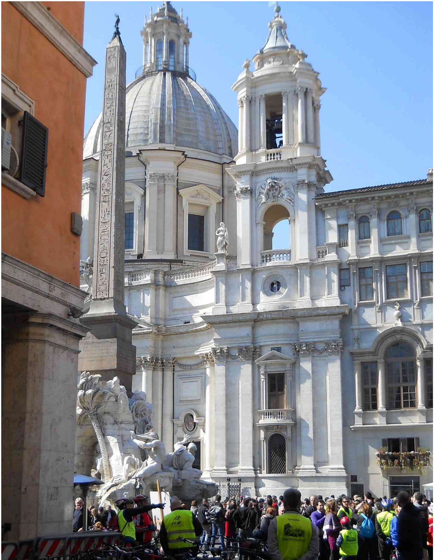
...piazza Navona con la stupenda Sant'Agnese in Agone (cap. 5)...