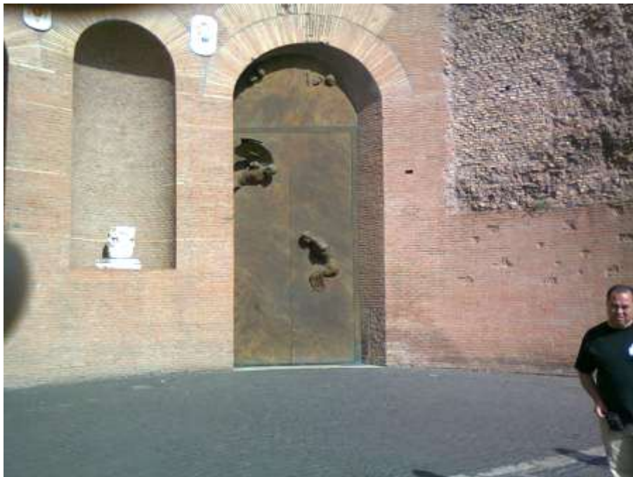
Due immagini delle nuove porte della basilica di Santa Maria degli Angeli, opera dell'artista polacco Igor Mitoraj, rappresentano: il Redentore e l'Annunciazione (2006).