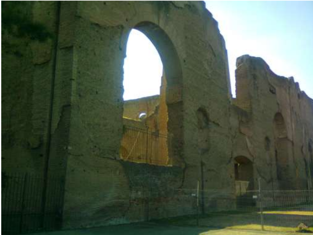
Le terme di Caracalla viste dal viale omonimo, si nota uno dei quattro ingressi originari, gli altri ambienti erano lo spogliatoio e ambienti di servizio che attorniavano la palestra.

Pistoletto "Il terzo paradiso" realizzata con marmi colossali delle stesse terme, in tre giorni sono stati posizionate 109 blocchi di marmo formanti il simbolo dell'infinito.