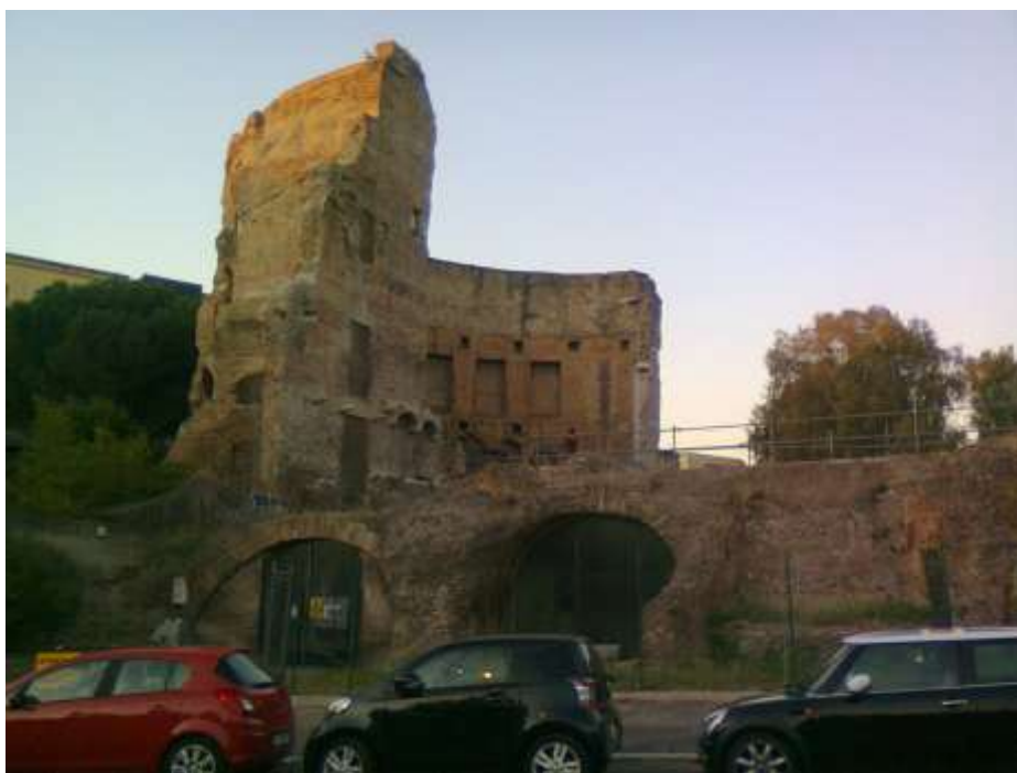
Colle Oppio, uno degli ambienti delle terme di Traiano.

Al principio del Parco è l'entrata alle rovine della Domus Aurea di Nerone, il palazzo imperiale costruito dopo l'incendio del 64 che non sopravvisse all'imperatore, l'area su cui si trovava la Domus Aurea venne divisa con diverse funzioni e il palazzo venne sepolto per la costruzione delle terme di Traiano. I vastissimi ambienti sotterranei furono già visti, ammirati e disegnati da diversi artisti del Rinascimento che da queste grotte, dette allora terme di Tito trassero i motivi decorativi detti "grottesche" e lasciarono i loro nomi incisi sulle pareti.