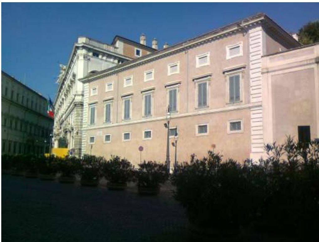
Palazzo Pallavicini Rospigliosi, in primo piano il casino che contiene l'Aurora di Guido Reni, a sinistra il palazzo della Consulta di Ferdinando Fuga. Al di sotto dei due palazzi vi sono i resti delle Terme di Costantino, le ultime costruite a Roma.

Per le dimensioni ridotte erano praticamente limitate al solo edificio termale con pochi annessi e una semplice area aperta.