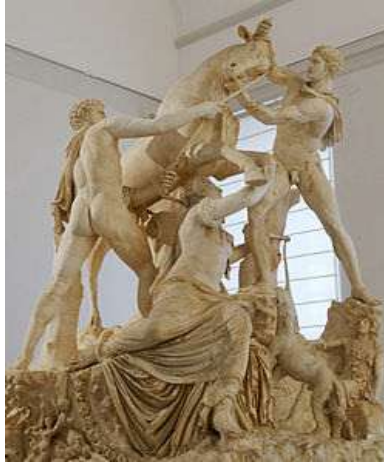
Il Toro Farnese, ritrovato nelle Terme di Caracalla, oggi al Museo Nazionale di Napoli.

L'ingresso era dalla via Nova, parallela all'Appia. Si entrava nel frigidarium, immenso salone rettangolare occupato quasi per intero dalla piscina. Al di là del frigidarium, e parallelo ad esso, si apriva il tepidarium, altro immenso salone collegato alle estremità attraverso esedre alle grandiose palestre. A metà del lato lungo del tepidarium si passava attraverso un altro tepidarium o cella media, assai più piccolo, nel calidarium salone circolare con cupola di m 35 di diametro, in gran parte diruito e interrato. Ai lati e intorno alle palestre numerose sale, rettangolari o absidate, per la ginnastica o per i servizi. Di fronte al calidario, oltre la vasta spianata si trovano le rovine dello stadio fiancheggiato da biblioteche.