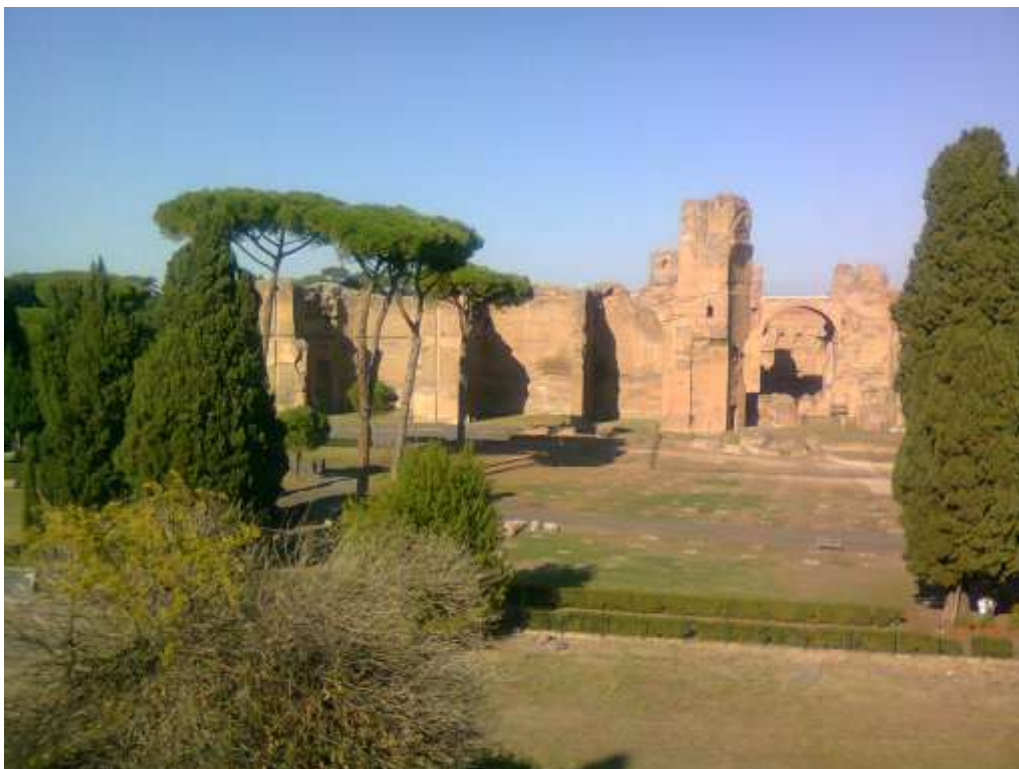
Le terme di Caracalla viste da viale Guido Baccelli

L'ingresso era dalla via Nova, parallela all'Appia. Si entrava nel frigidarium, immenso salone rettangolare occupato quasi per intero dalla piscina. Al di là del frigidarium, e parallelo ad esso, si apriva il tepidarium, altro immenso salone collegato alle estremità attraverso esedre alle grandiose palestre. A metà del lato lungo del tepidarium si passava attraverso un altro tepidarium o cella media, assai più piccolo, nel calidarium salone circolare con cupola di m 35 di diametro, in gran parte diruito e interrato. Ai lati e intorno alle palestre numerose sale, rettangolari o absidate, per la ginnastica o per i servizi. Di fronte al calidario, oltre la vasta spianata si trovano le rovine dello stadio fiancheggiato da biblioteche.