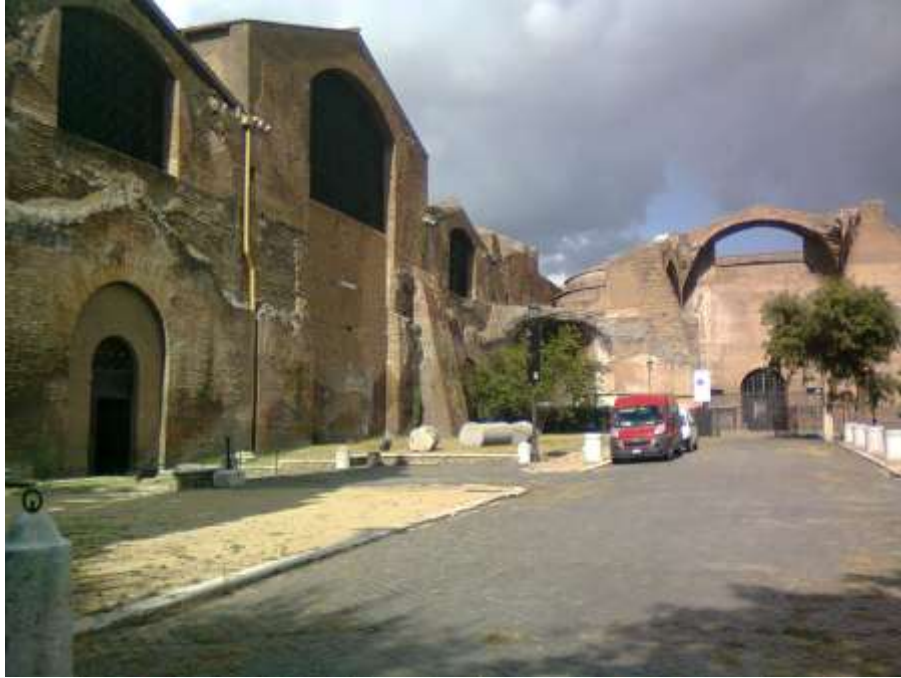
Ambienti interni alle terme di Diocleziano.

La pianta del colossale stabilimento - che poteva ospitare 3.000 bagnanti contemporaneamente - era analoga a quella delle altre terme: un corpo di fabbrica centrale circondato da giardini con ninfei, esedre e con gruppi di sale all'interno. L'esedra principale, che serviva da cavea per assistere alle esercitazioni ginnastiche, è ripetuta nelle sue linee generali (m 144 di diametro) dai palazzi del Koch in piazza della Repubblica, non era interrotta però nel mezzo da via Nazionale perchè allora l'ingresso alle terme era dal lato opposto.