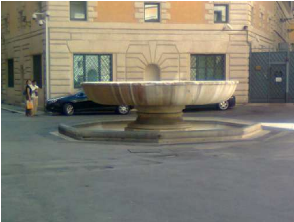
Fontana della vasca romana al Senato.

Le terme Neroniane o Alessandrine, perchè costruite da Nerone e restaurate da Alessandro Severo, vennero costruite nel 62 ed ebbero successivi rifacimenti. Si trovavano nell'area che oggi è compresa tra piazza della Rotonda e via della Dogana Vecchia, coprivano un rettangolo di m 190 X 120. Erano alimentate dallo stesso acquedotto dell'Acqua Vergine che riforniva le terme di Agrippa. Dopo il restauro di Alessandro Severo furono alimentate dall'acquedotto Alessandrino.