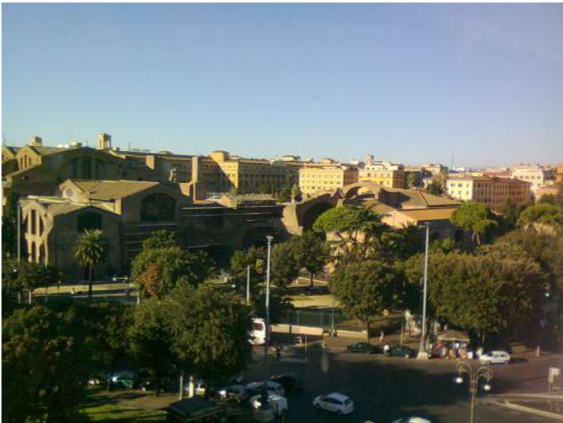
Le terme di Diocleziano viste dall'alto del palazzo Massimo, tutte le foto di questo testo sono di Piero Tucci se non diversamente indicato.

Iniziate nel 298 e compiute tra il 305 e il 306 per volere dell'imperatore Diocleziano 1 . Erano le più grandiose di Roma e coprivano una superficie di 376 X 361 metri, corrispondenti press'a poco allo spazio rettangolare compreso tra la piazza di San Bernardo e il cortile della Corte dei Conti nel palazzo del Ministero delle Finanze a Nord Ovest, la via del Viminale e la piazza dei Cinquecento a Sud Est, la via Volturno a Nord Est e la via Torino a Sud Ovest. Per la sua costruzione furono impiegati 40.000 cristiani, comunque tra i ruderi sono stati trovati mattoni sui quali sono impressi segni di croce.