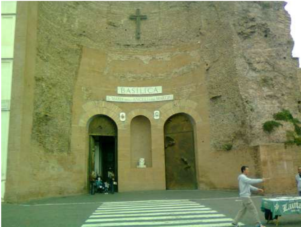
La chiesa di Santa Maria degli Angeli, l'attuale facciata era un ambiente del calidarium.