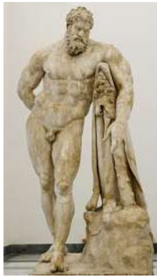
L'Ercole Farnese, dall'originale di Lisippo, ritrovato nelle Terme di Caracalla privo dell'avanbraccio, reintegrato in gesso e delle gambe poi rivenute nel Settecento e ricollocate, oggi al Museo Archeologico di Napoli.

Il ciclopico complesso delle Terme, dette anche Antoniniane, forma uno dei più impressionanti e pittoreschi scenari della Roma antica. Furono iniziate da Settimio Severo nel 206 e inaugurate dal figlio Antonino Caracalla 4 nel 217. L'opera venne completata dai successori Elagabalo e Alessandro Severo. Ancora Aureliano le restaurò, erano le più ricche di ornamenti di Roma. Funzionavano ancora nel VI secolo quando furono danneggiate dai goti e rese inutilizzabili per la distruzione degli impianti idrici che erano di una straordinaria perfezione (le cisterne erano capaci di contenere 80.000 litri d'acqua) 5 . La planimetria segue il tipo stabilito fin dal II secolo, un grande corpo di fabbrica centrale, circondato da giardini, entro un vastissimo recinto rettangolare con esedre, sale e altri ambienti accessori. Occupavano uno spazio quadrato di m 330 per lato, l'edificio centrale misurava m 220 X 114.