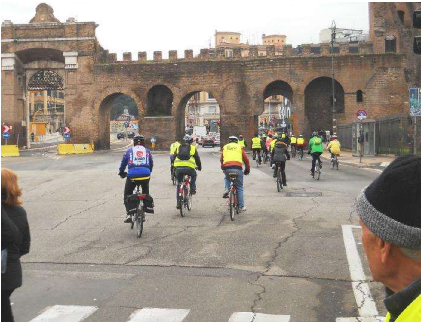
... passiamo Porta San Giovanni , via Appia, via Cave, via Tuscolana passando Porta Furba ....