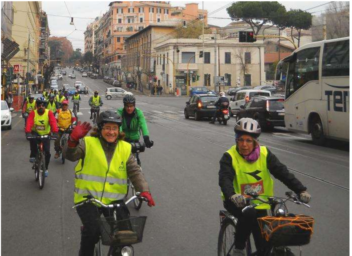
Percorriamo via Labicana, via Emanuele Filiberto ...