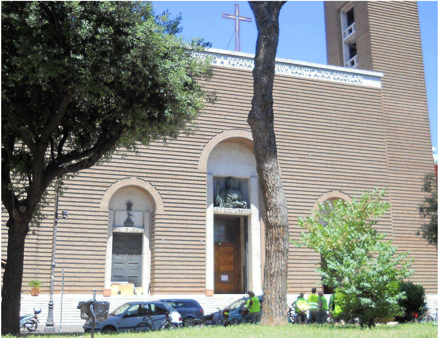
...la monumentale Chiesa di Cristo Re (M. Piacentini 1924-34). C.C.