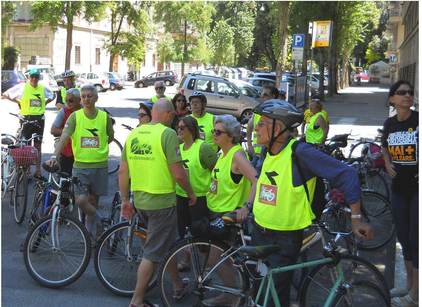
...il villino degli Artisti, (Del Debbio, 1924) siamo in via Carso, angolo via A. Chinotto...