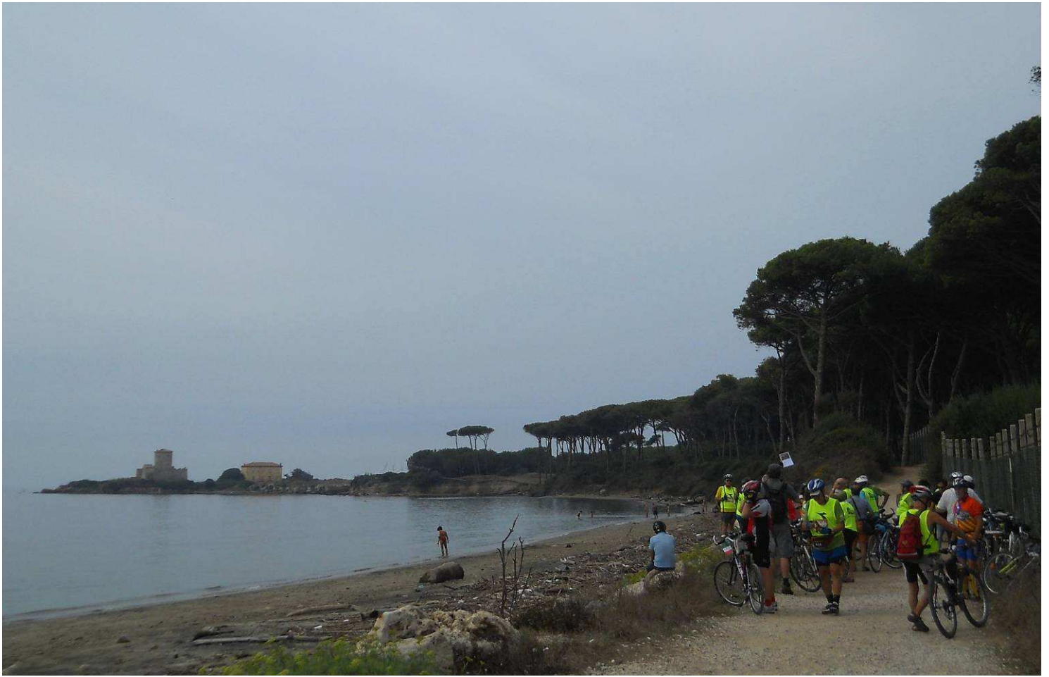
....dove entriamo ad ammirare la Torre Astura e la sua splendida cornice....