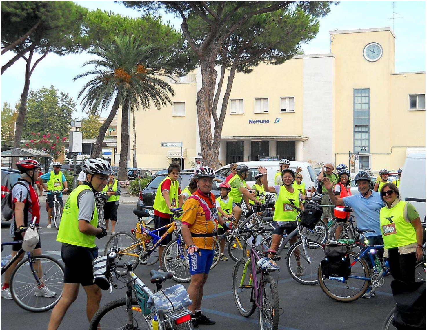
Appuntamento h 9,30 alla stazione di Nettuno , siamo in 27, provenienti in maggioranza da Roma Termini ed altri con mezzi propri.....