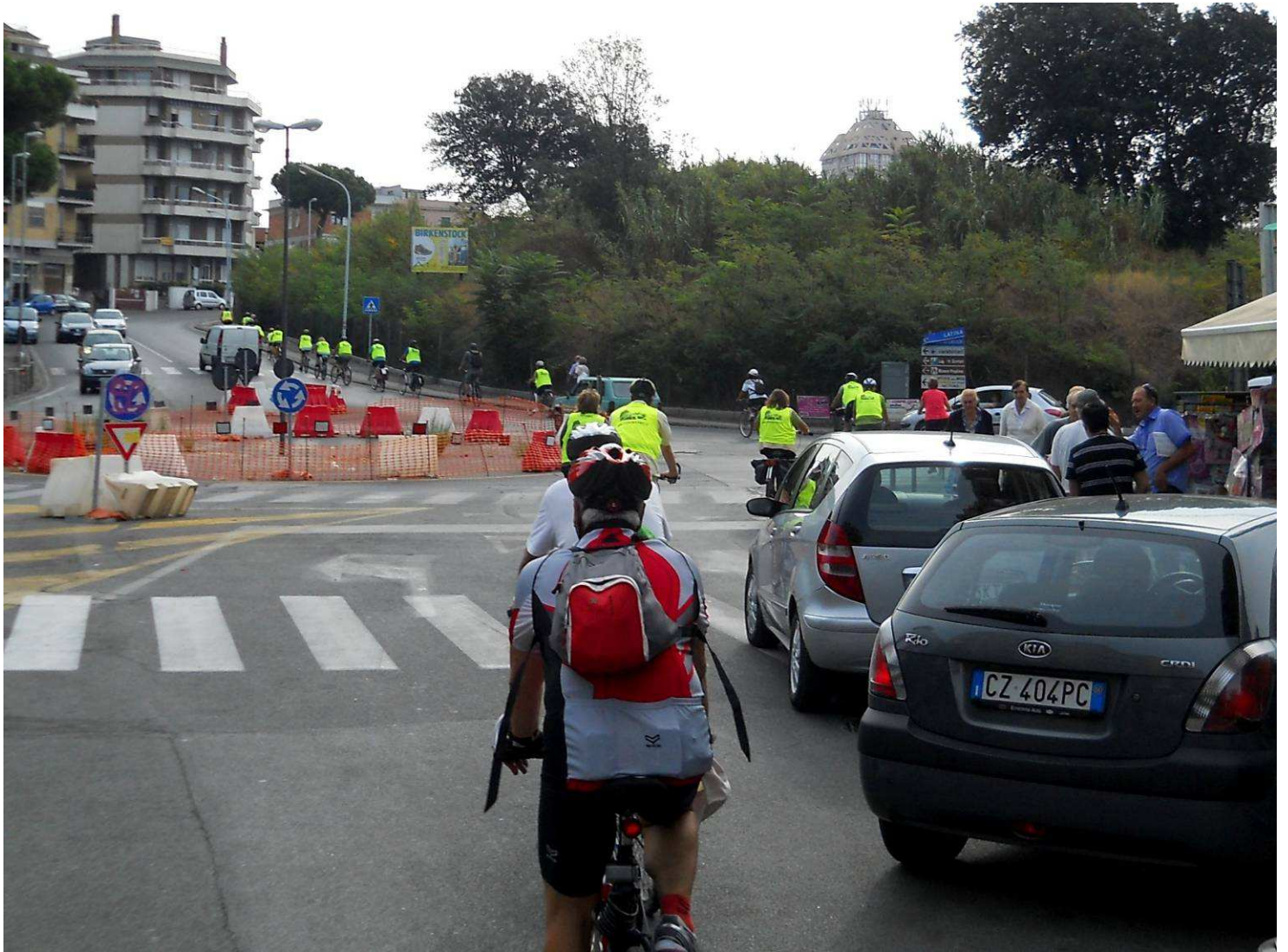
.....attraversiamo Nettuno in direzione sud...