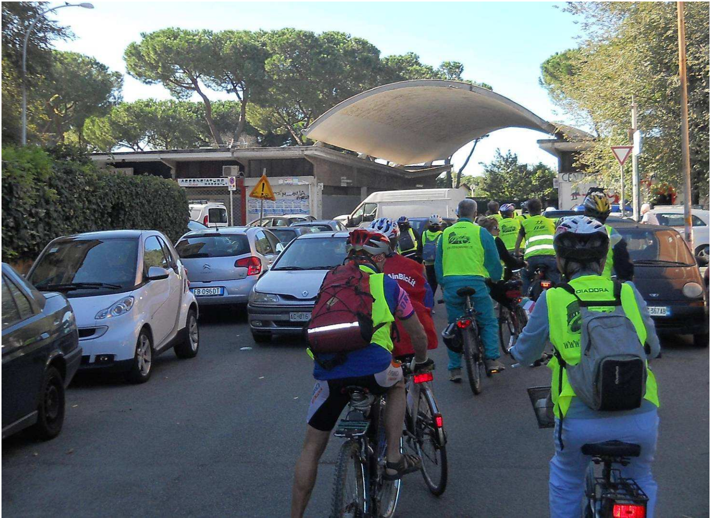
...in via Selinunte, questo passaggio sormontato di pensilina, in asse con via Sagunto, è l'ingresso del Tuscolano III...