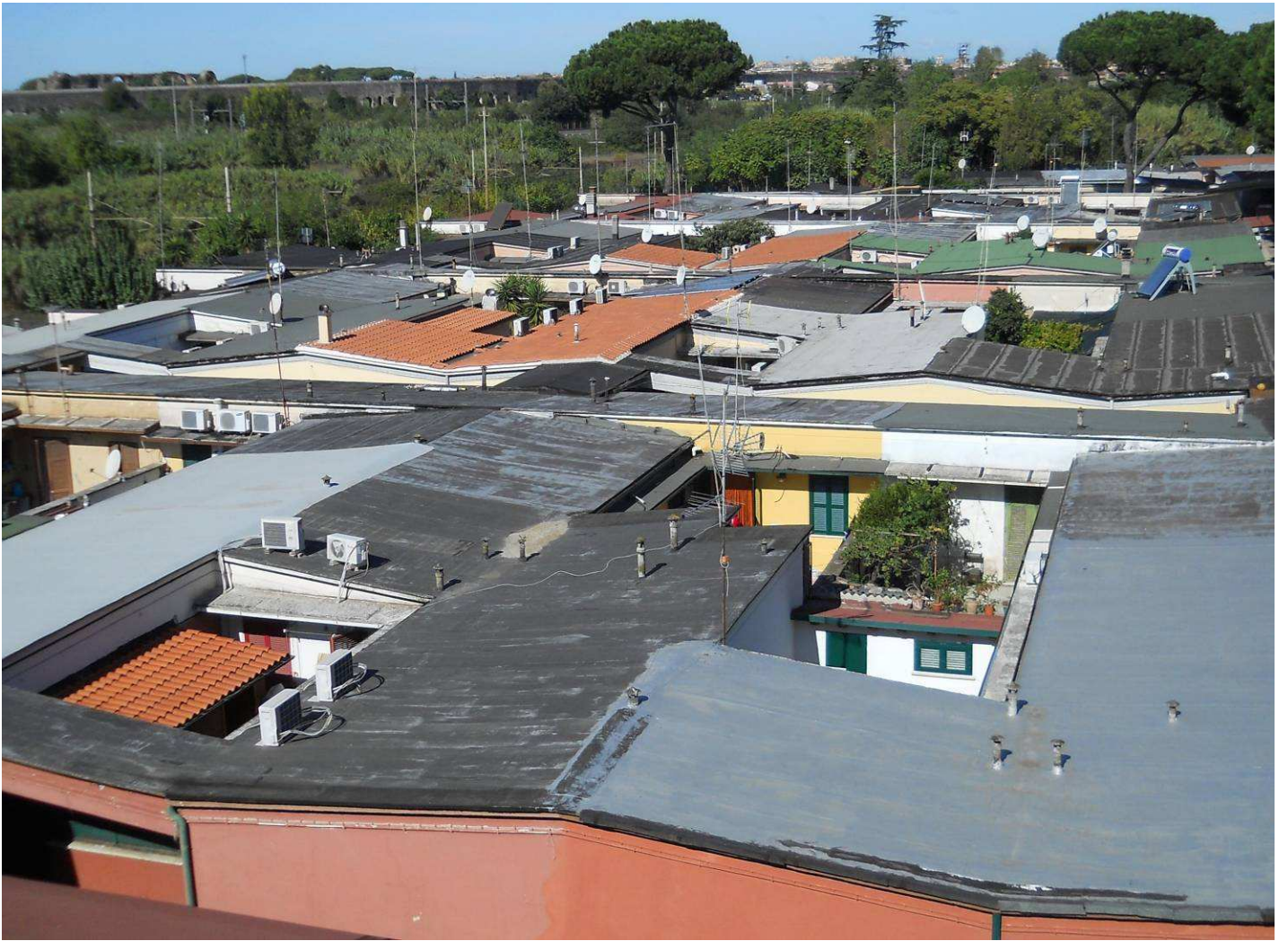
...la famosa casba ....