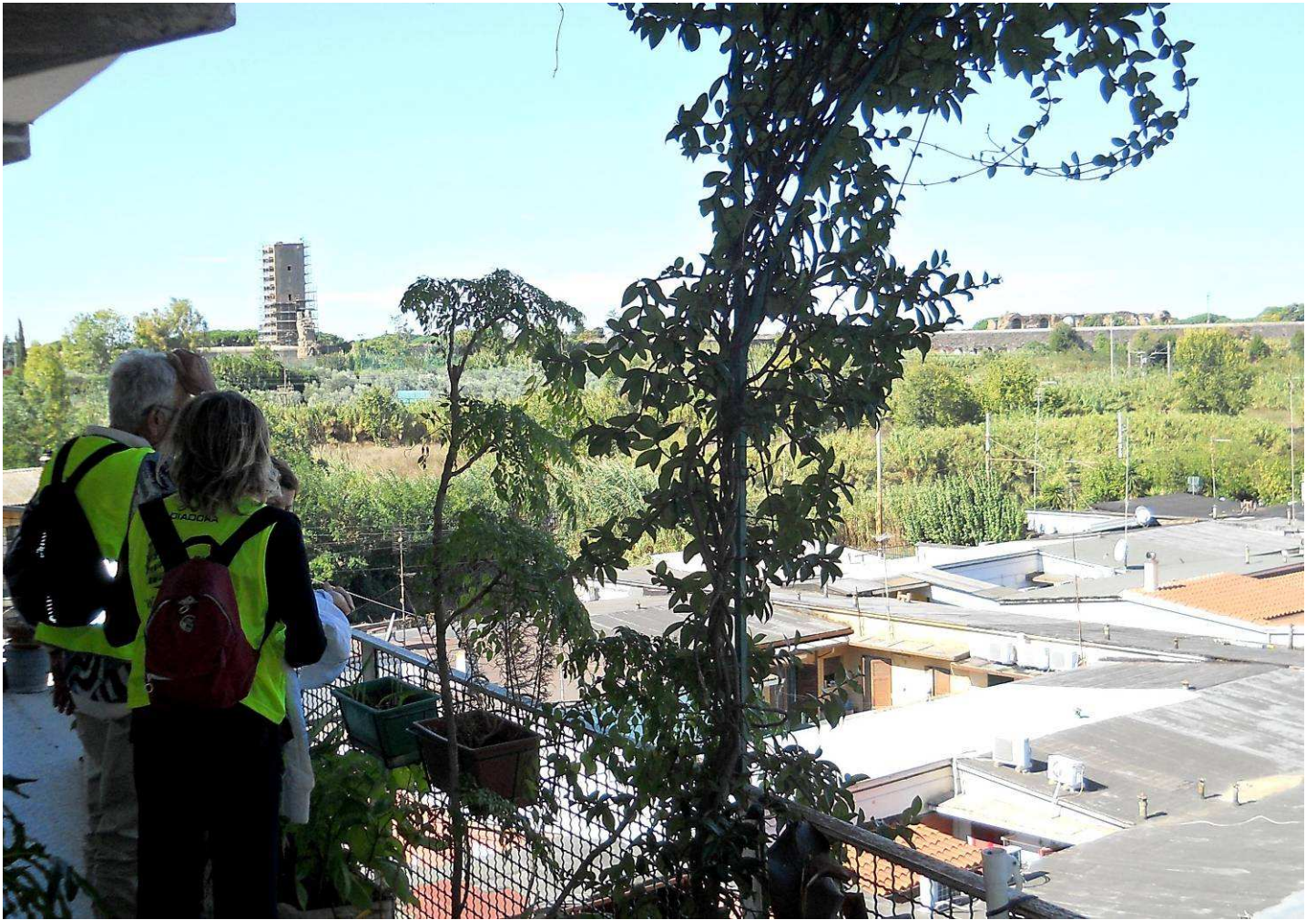
...Tor Fiscale in fase di restauro, l'acquedotto Felice, la ferrovia Rm-Na e ...