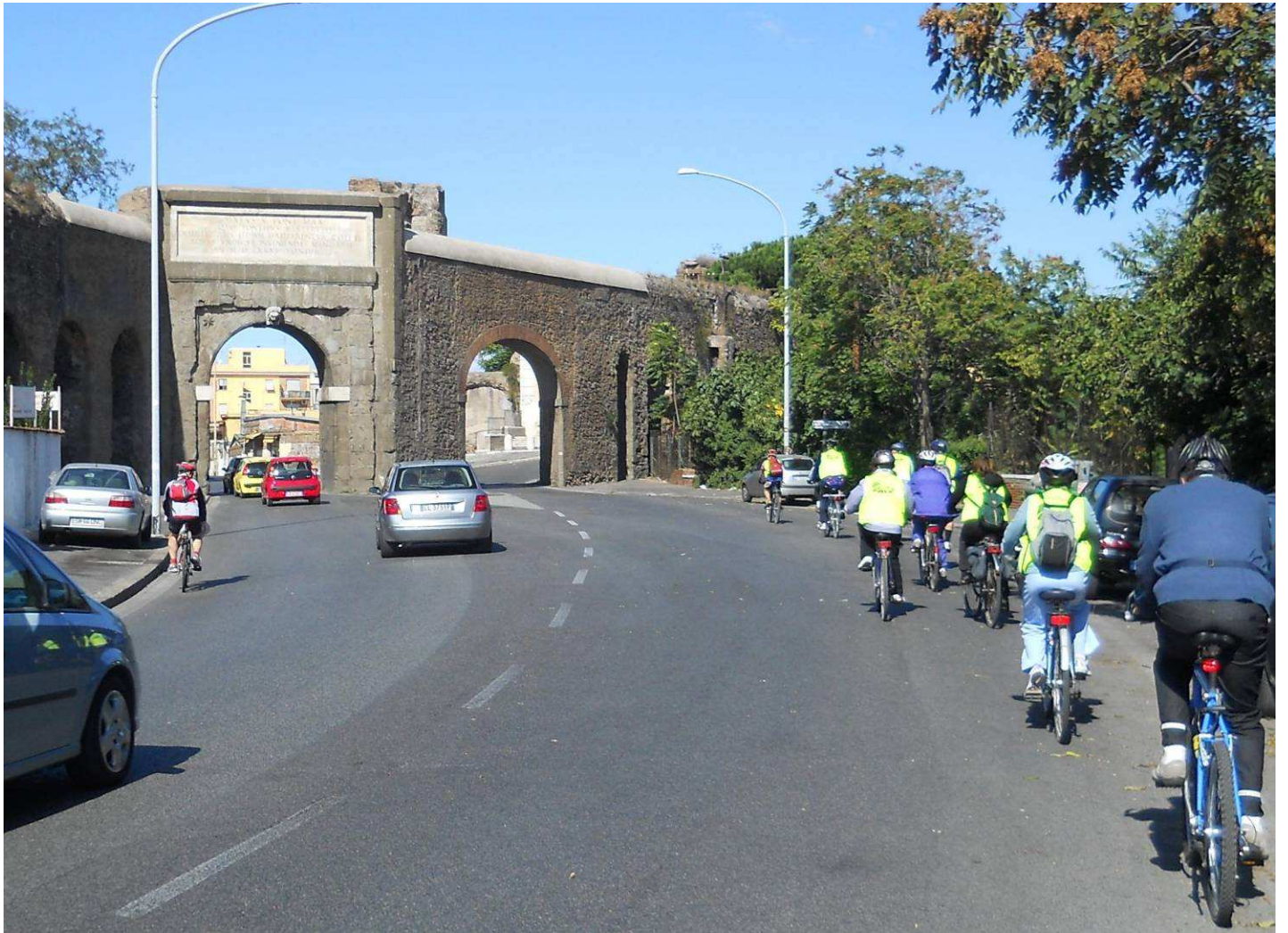
....passando da Porta Furba. C.C.