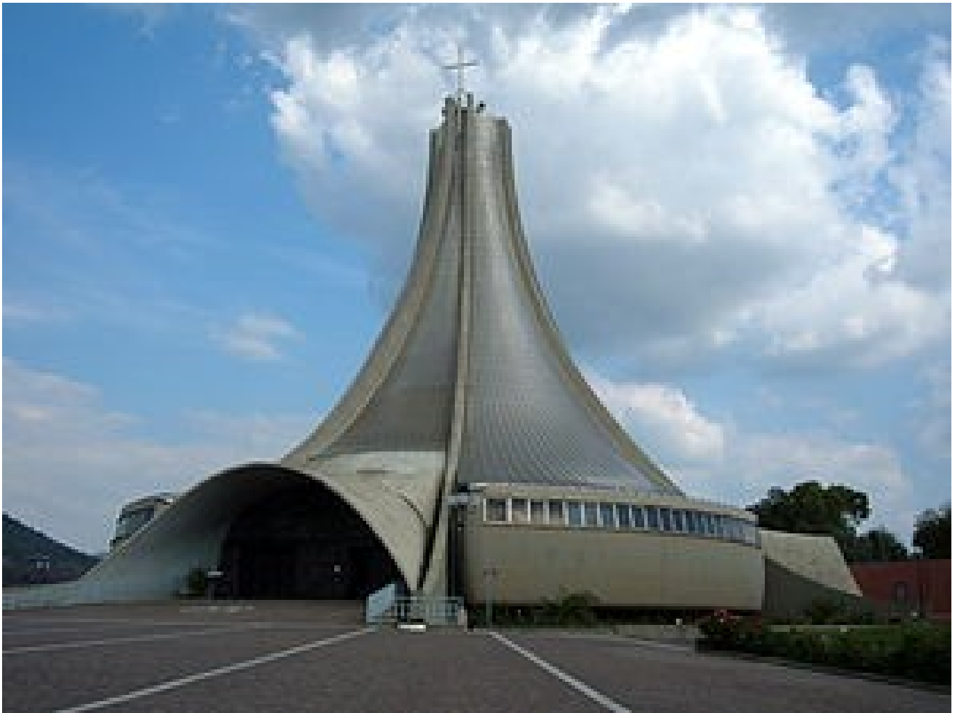
Santuario di Nostra Signora di Fatima

Hanno provato il percorso e quindi saranno le nostre guide: