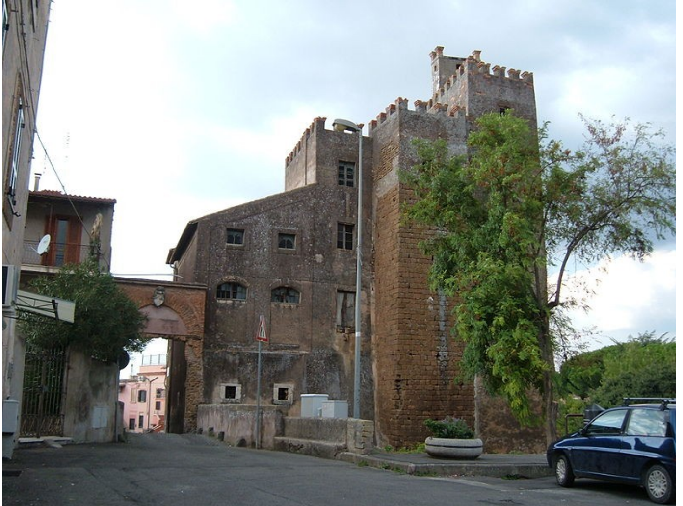
Castello Barberini di San Vittorino