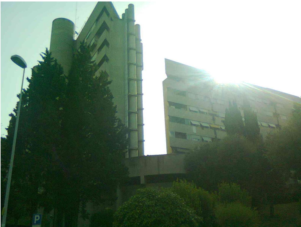
Il quartiere di Vigne Nuove da via Dina Galli.