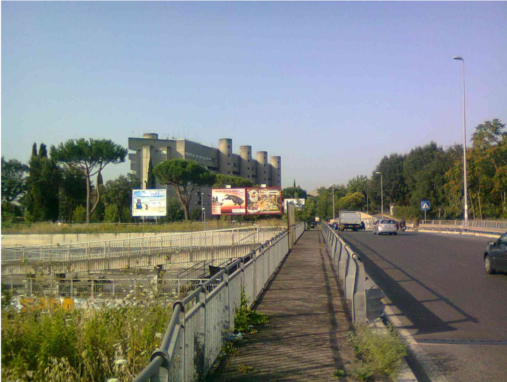
Il quartiere di Vigne Nuove dal viadotto Segni.