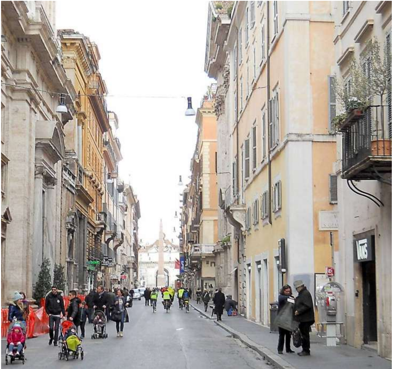
...attraversiamo il centro verso via Flaminia e la pista....