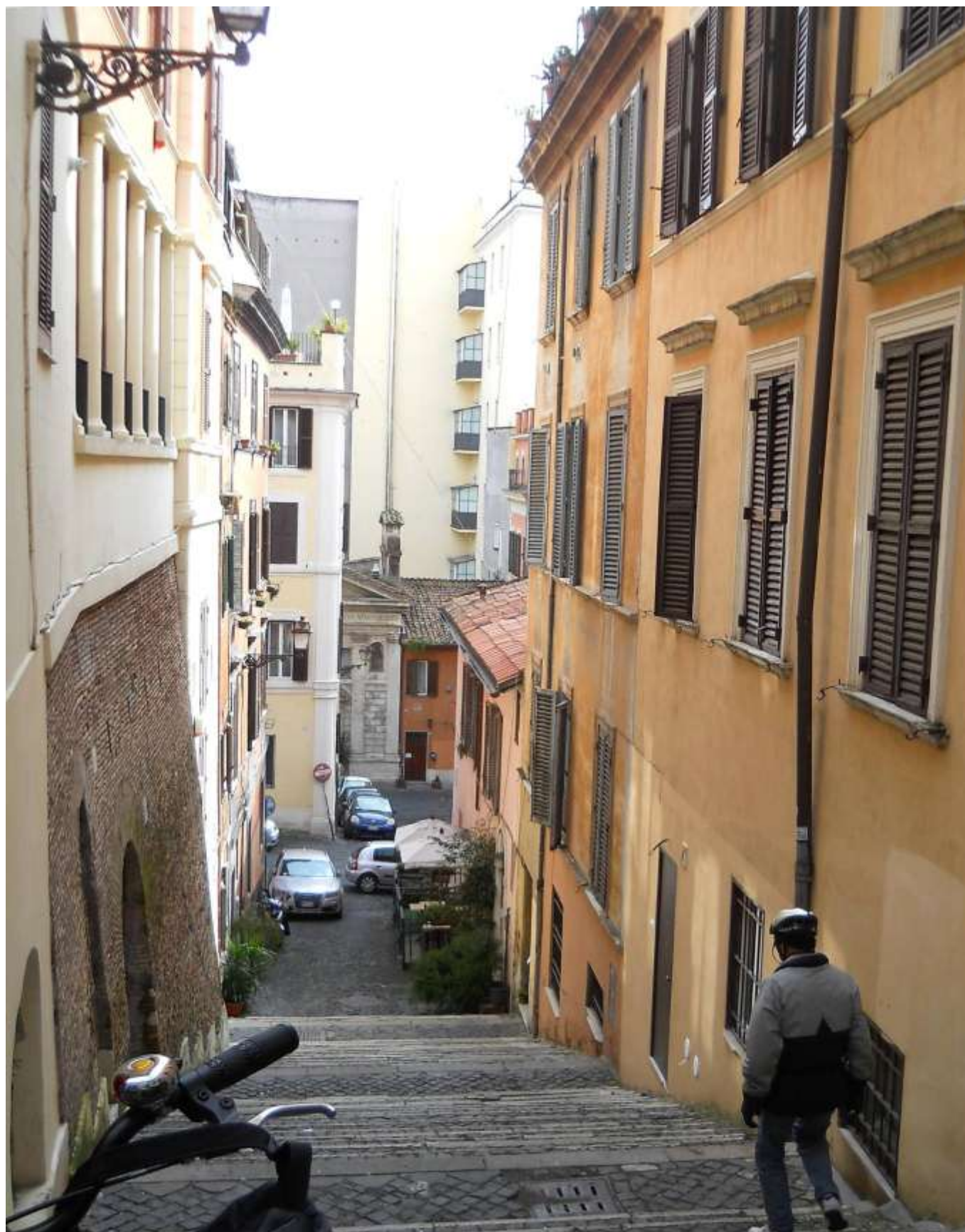
Copertina della ciclo-passeggiata: la "scalinatella" del vicolo de' Ciancaleoni verso via Urbana, una vera "chicca" a sorpresa... molto intima, un po' bohémien...