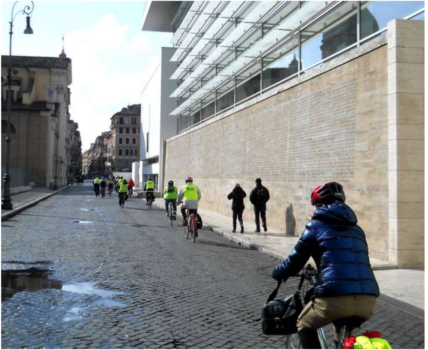
....davanti all'Ara Pacis ....