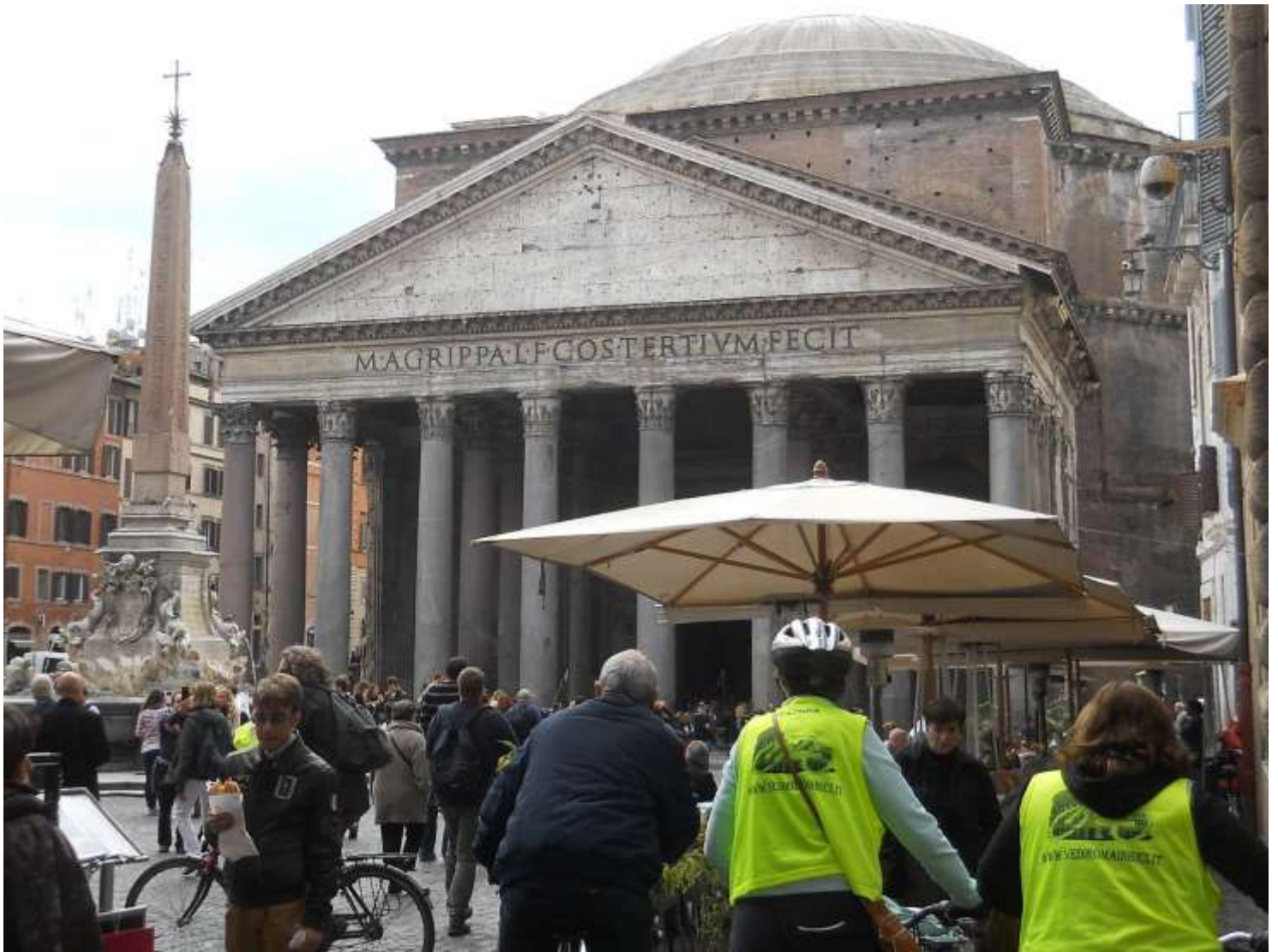
...a poca distanza: piazza del Pantheon...