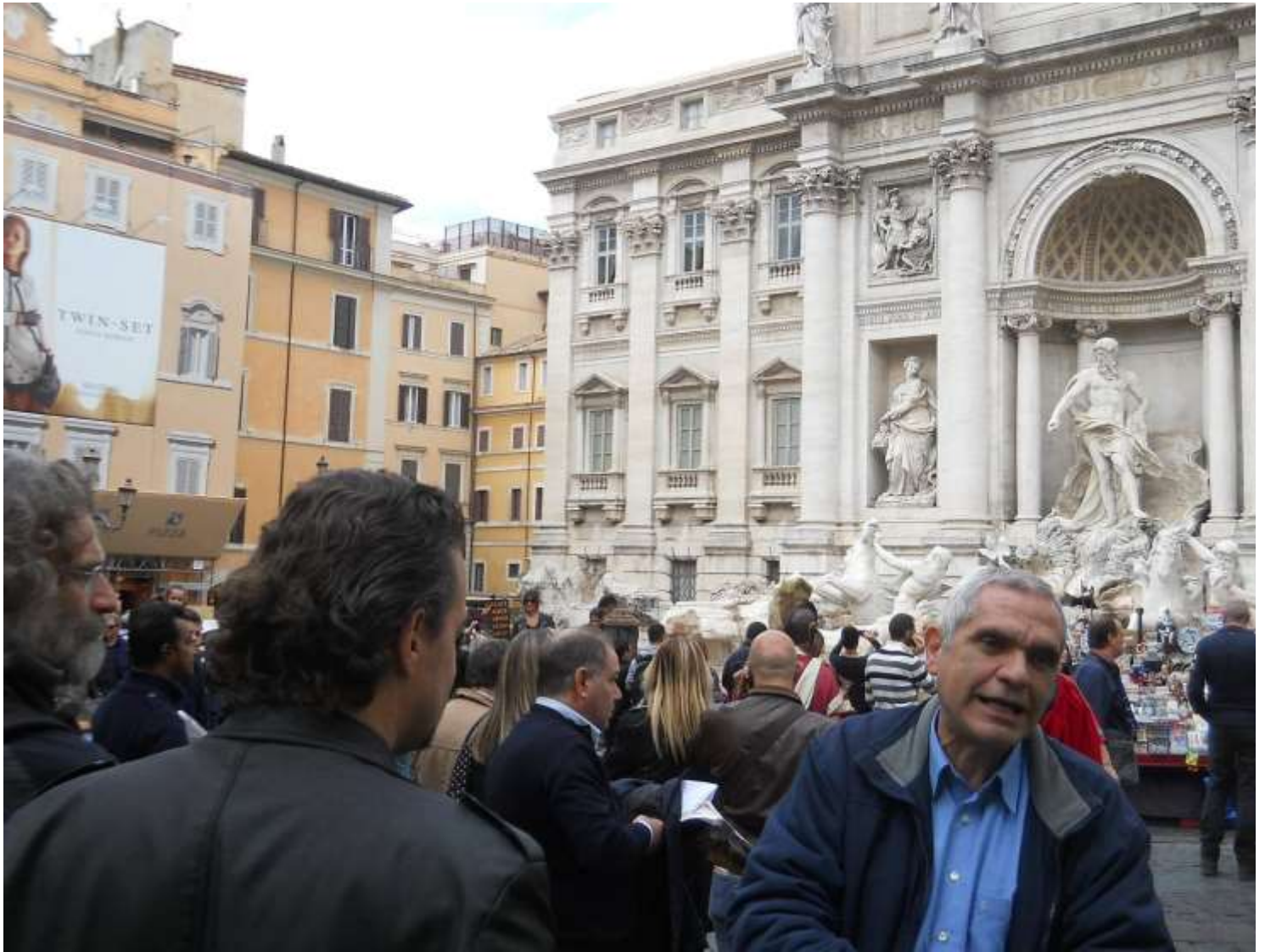
....fontana di Trevi...