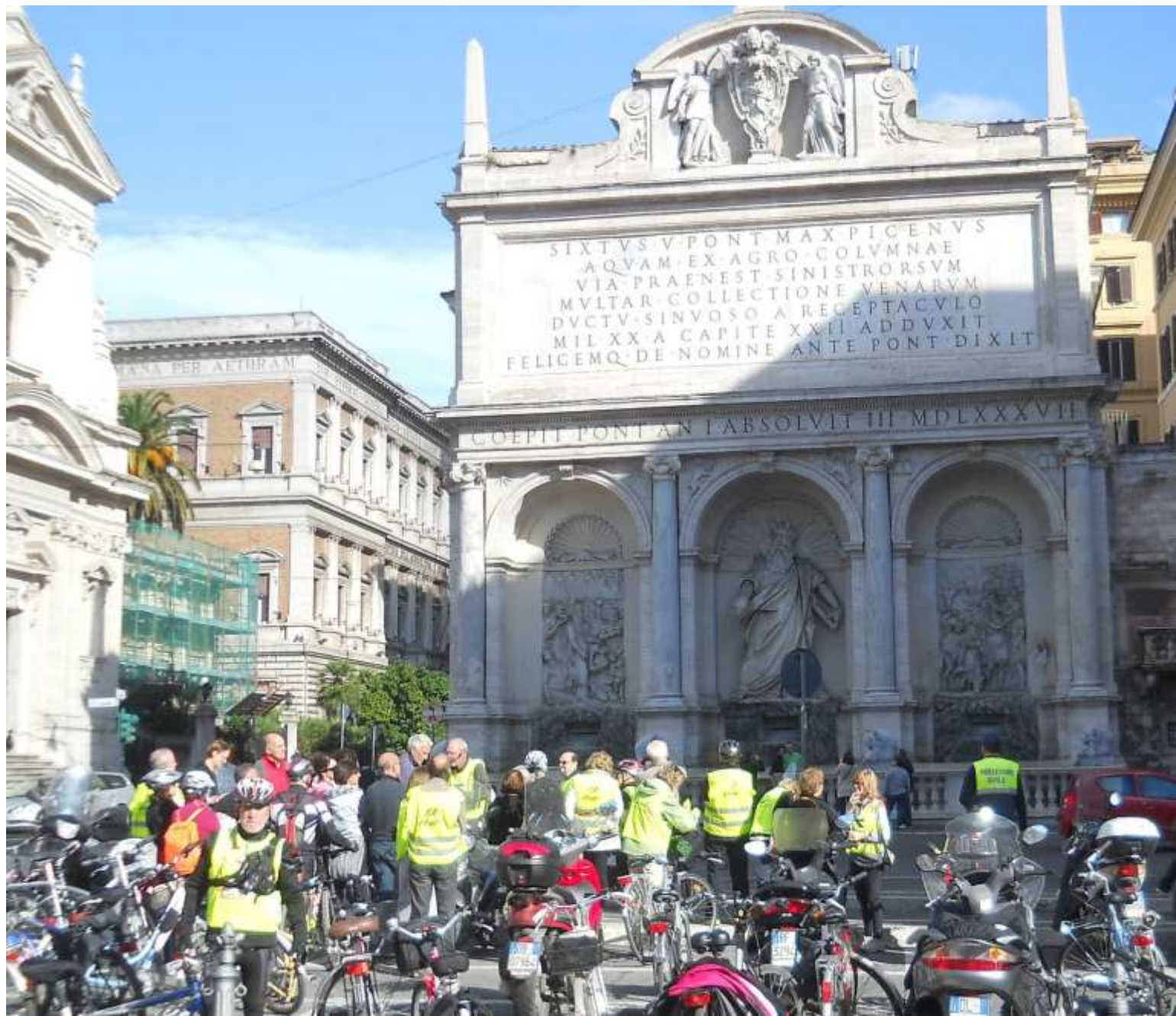
...gli stemmi, l'epigrafe ed altri dettagli di questa "grandiosa mostra" dell'acqua Felice in Piazza San Bernardo .