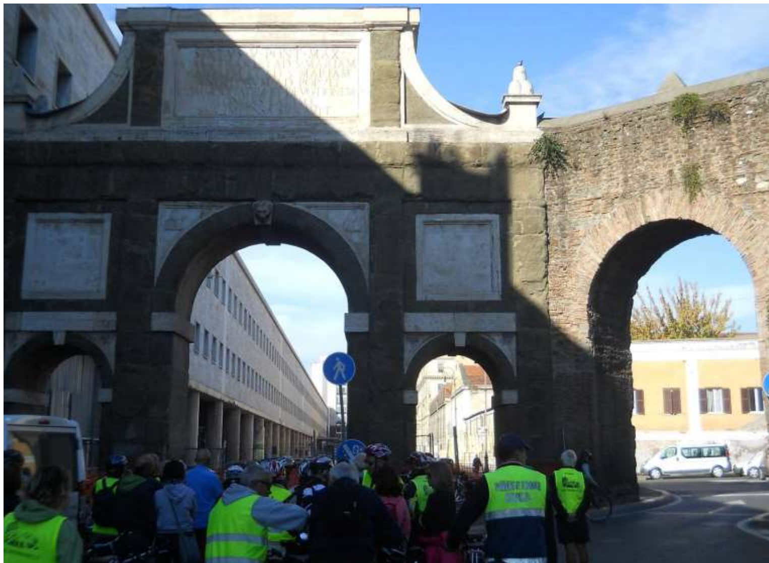
Siamo a Largo Sisto V (papa Felice Peretti) in un altro passaggio monumentale dell'acquedotto Felice.