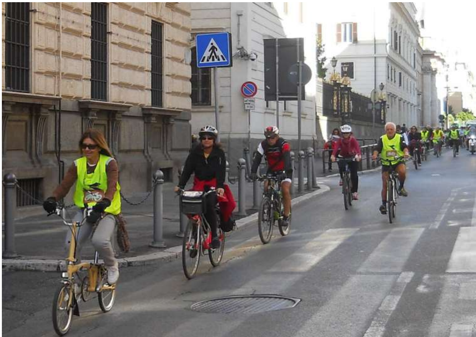
Ultima pedalata verso il Quirinale...