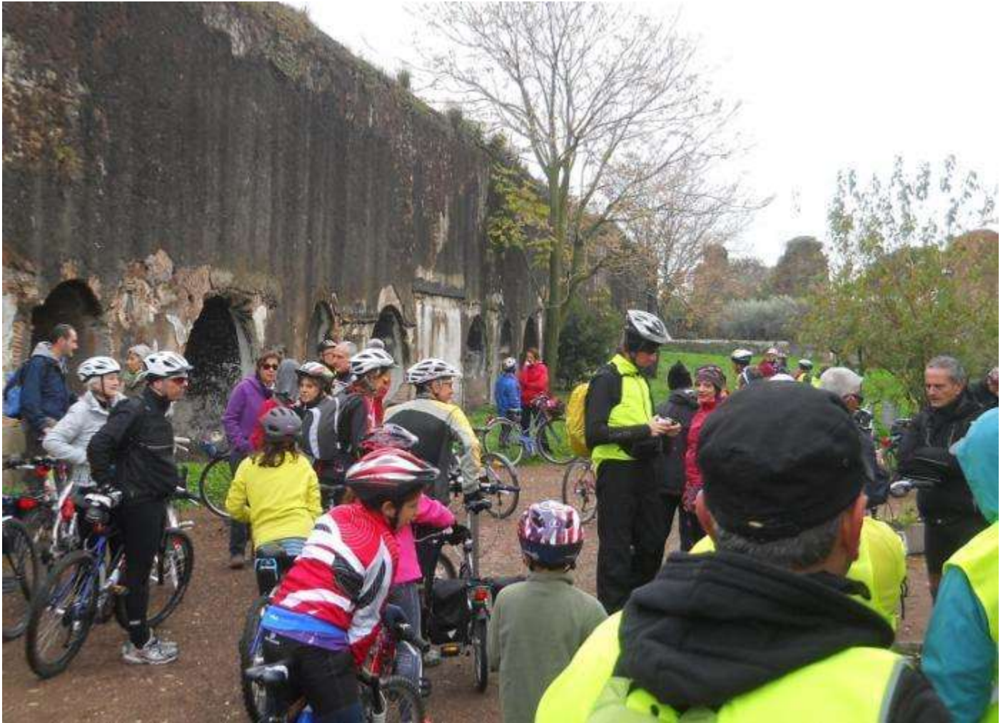
... un passaggio nel Parco degli Acquadotti ...