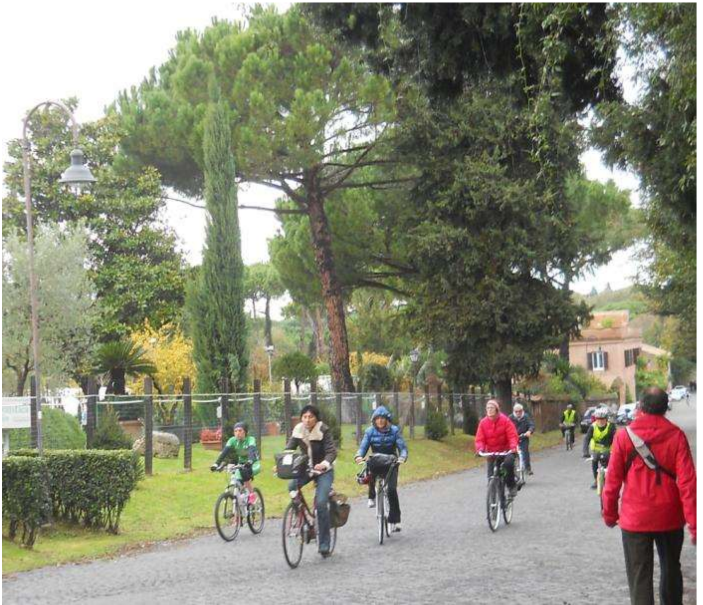
... partecipanti alla pedalata ...