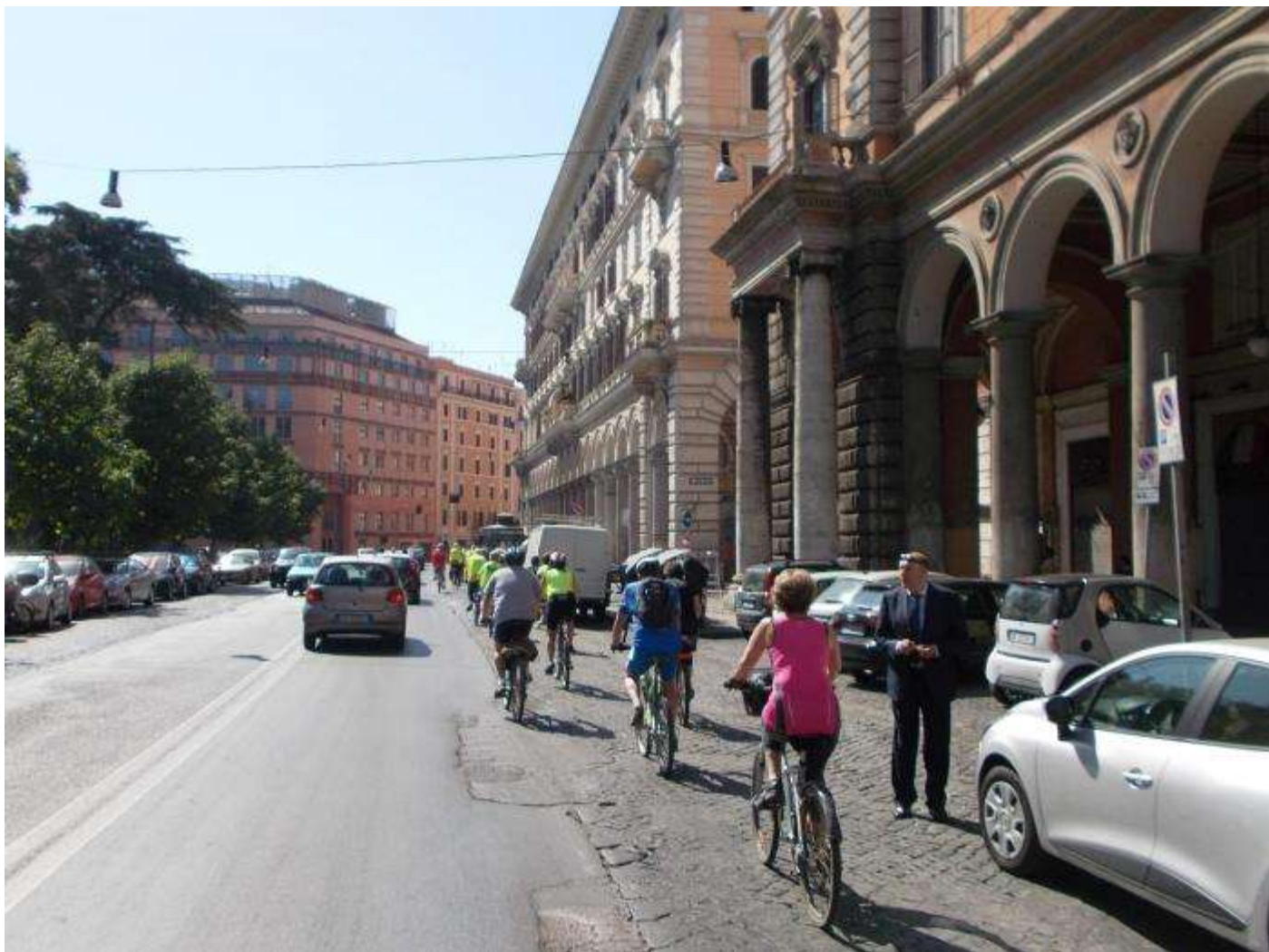
... qui passiamo da Piazza Vittorio ...