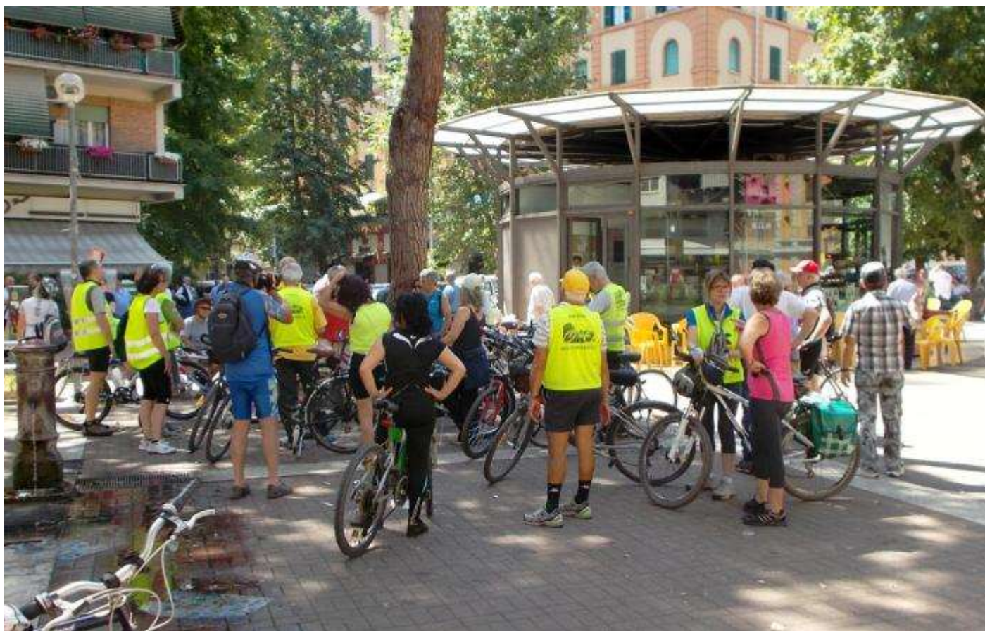
La piazza, con molti negozi, è stata riqualificata recentemente, pedonalizzata, dotata di un chiosco bar ...