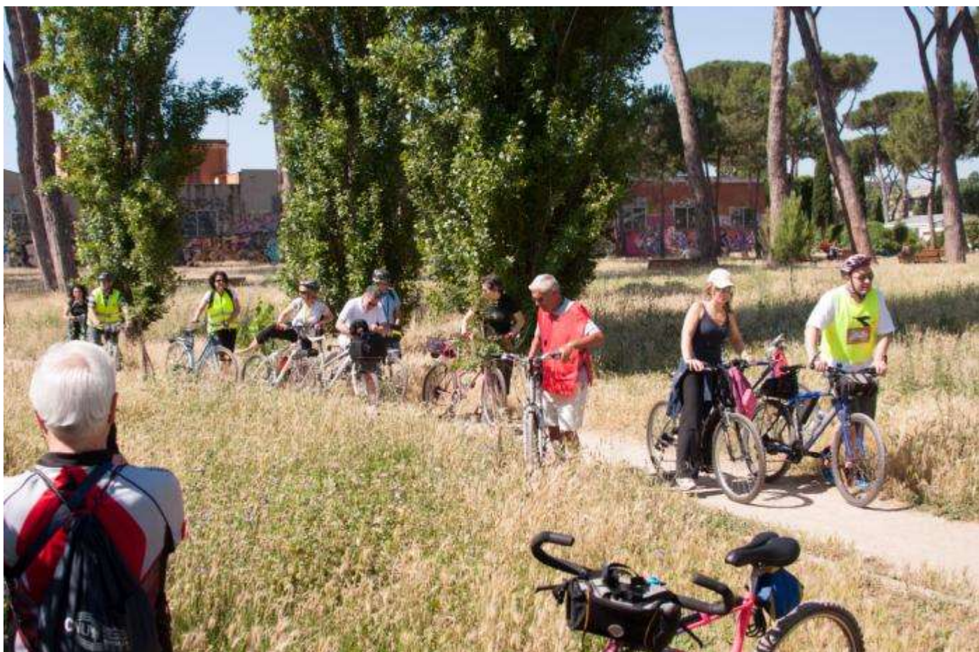
... anche il parco, nonostante lo stato di semi-abbandono ...